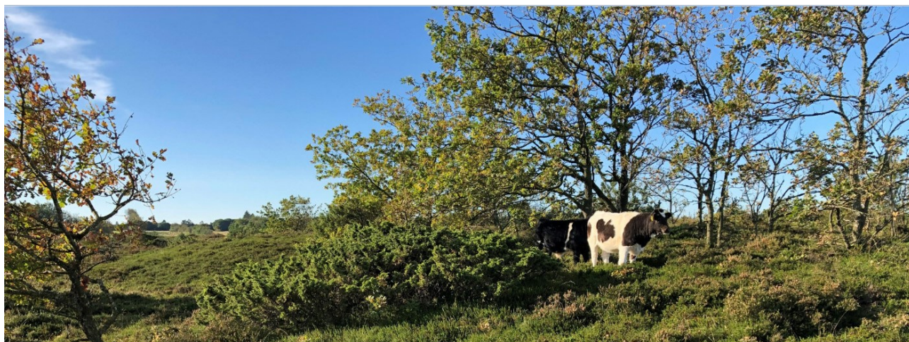
Afgræsning på Ajstrup Hede.

Effekten af indsatserne bliver løbende vurderet i det Nationale Overvågningsprogram for Vandmiljø og Natur (NOVANA), som overvåger vandmiljøets og naturens tilstand inden for de områder, der prioriteres i forhold til de politisk fastsatte økonomiske rammer. I dette område er der foretaget overvågning i 2017 suppleret med undersøgelse af de nyudpegede Natura 2000-delområder i 2019.