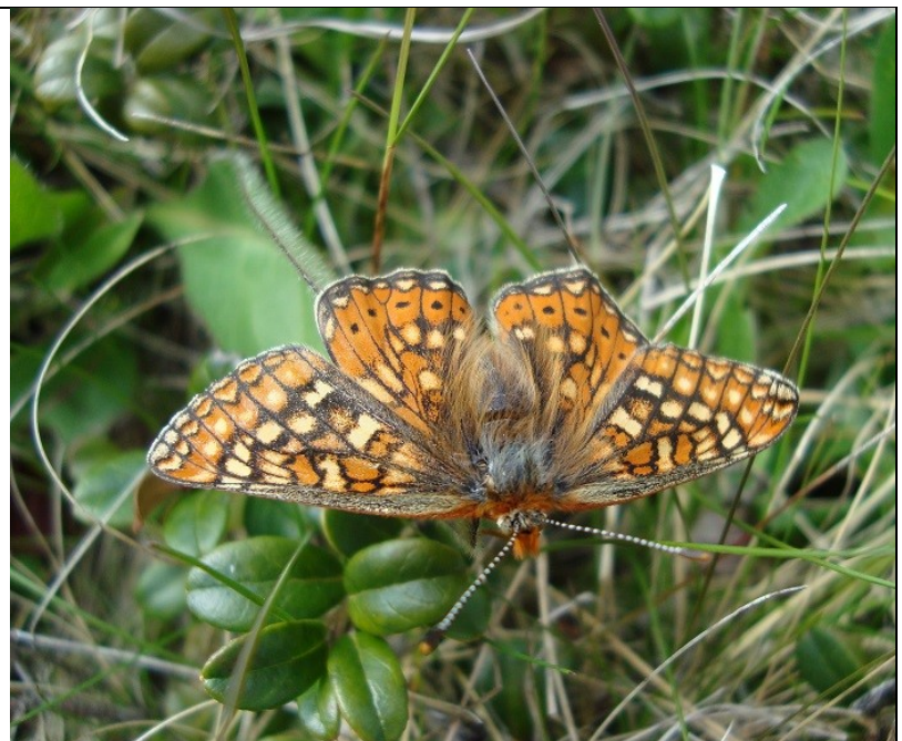
Guldblomme og hedepletvinge.